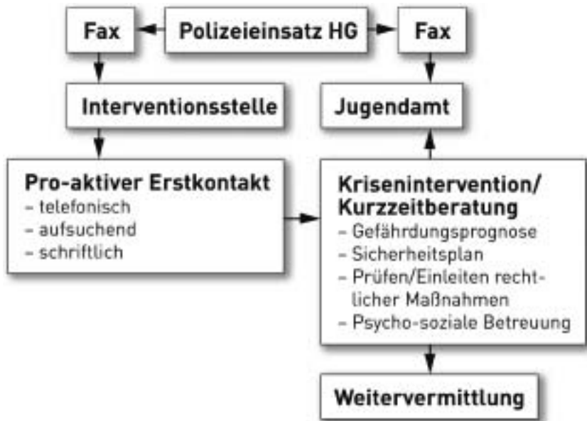
Abb. 1 Interventionskette

Die folgende Übersicht macht deutlich, wie die Unterstützung der Interventionsstelle im Einzelfall aussieht.